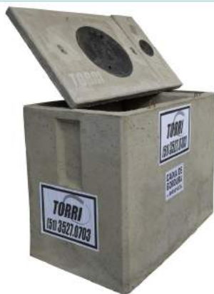
CAIXA RETENTORA DE GORDURA