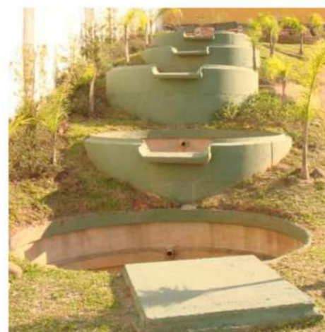
CAIXAS DE INSPEÇÃO P/ INSTALAÇÕES EM GERAL NO SISTEMA CAIXAFÁCIL®/ANELFÁCIL®